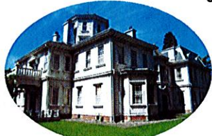
てんきょうかく E. 天鏡閣