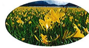
おくにぬま H. 雄国沼とニッコウキスゲ