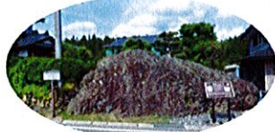
みね おおいし C. 見衾の巨石