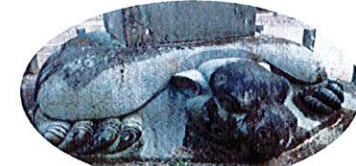
はにつじんじゃ れいじんのひ J. 土津神社の霊神之碑