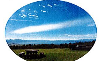
てんきょうだい K. 天鏡台