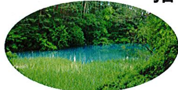
あおぬま D. 青沼 (五色沼湖沼群の一つ)