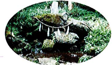
りゅうがさわゆうすい I. 龍ヶ沢湧水