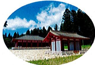
しせきえにちじあと B. 史跡慧日寺跡