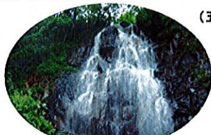
まぼろし F. 幻の滝