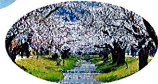
かんのんじがわさくらなみき A. 観音寺川桜並木