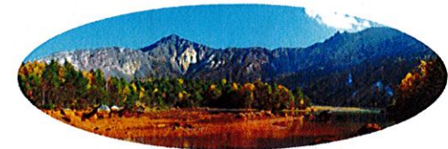
ほうかいへき あかぬま G. 磐梯山崩壊壁と銅沼