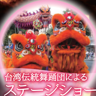
台湾伝統舞踊団による ステージショー