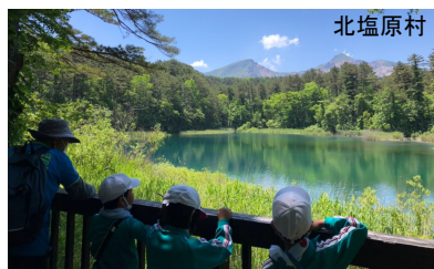
磐梯山ととり沼(五色沼湖沼群)