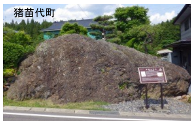
見衾の大石(国天然記念物)