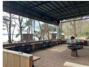
Roots猪苗代 Lake Area