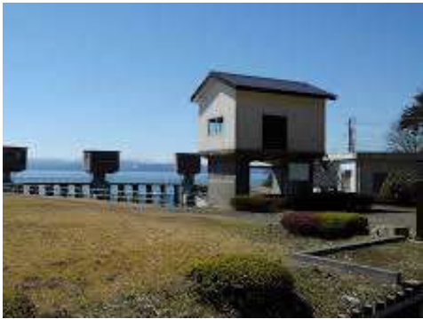
安積疏水「上戸頭首工」