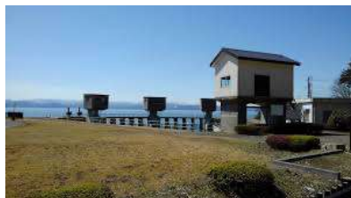
安積疏水「上戸頭首工」