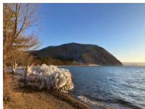
五万堂山と上戸浜