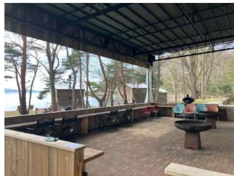
Roots猪苗代 Lake Area