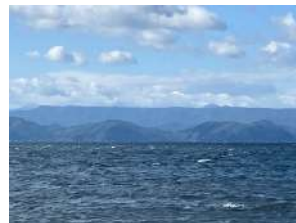
高原の風車と〇〇台地